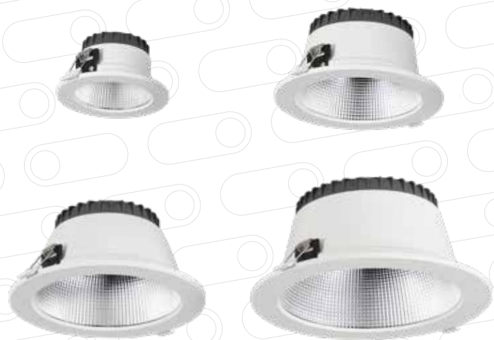
Empotrar 10W / 20W / 28W / 35W