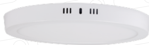
Breno CL Superficie