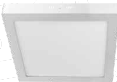
Breno SQ Superficie