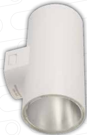
Directo / Indirecto