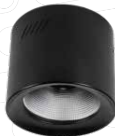
Superficie (20W / 35W)